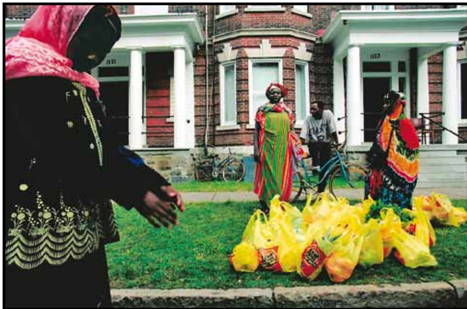
Σομαλοί Μπαντού στο ξεκίνημα της καινούριας ζωής τους στις ΗΠΑ.