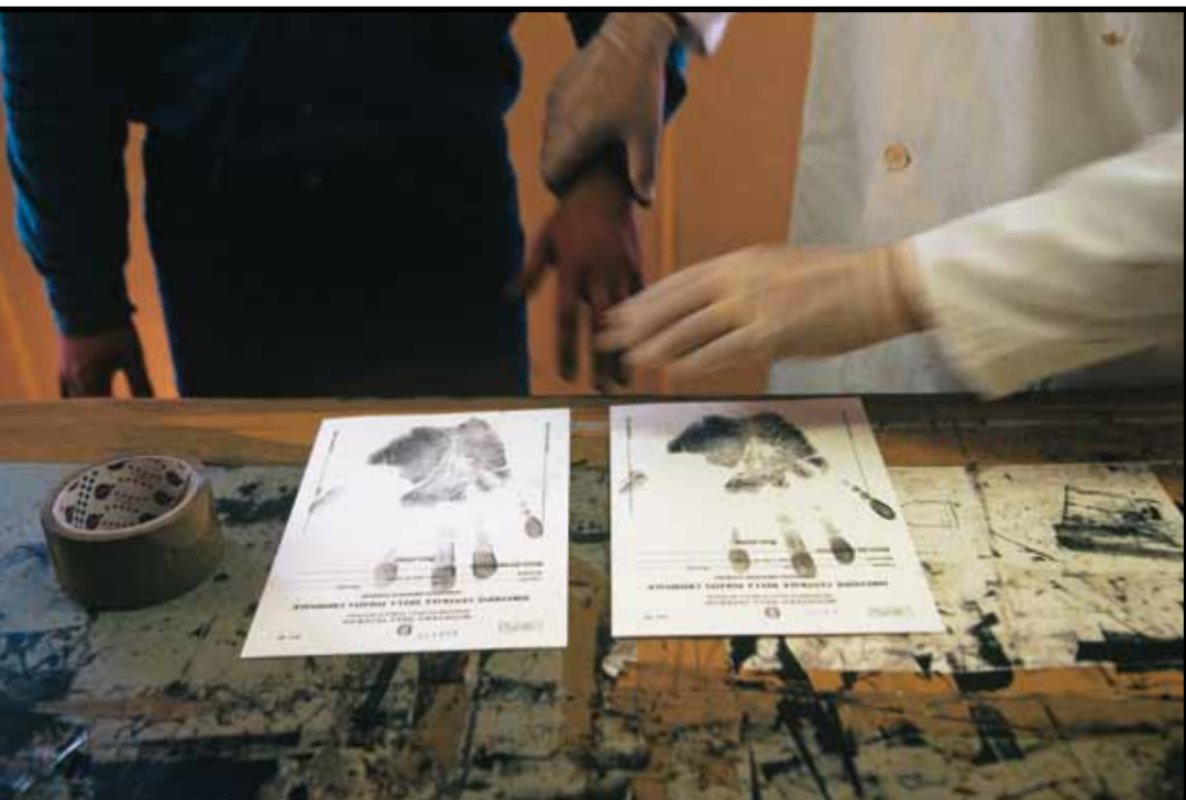
Λήψη δακτυλικών αποτυπωμάτων από αιτούντες άσυλο στην Ιταλία.

δύσκολο έργο. Η Εκτελεστική Επιτροπή της Ύπατης Αρμοστείας του ΟΗΕ για τους Πρόσφυγες (της οποίας τα μέλη ανέρχονται σε 70) καθορίζει μη-δεσμευτικές βασικές αρχές, ενώ το «Εγχειρίδιο για τις Διαδικασίες και τα Κριτήρια Καθορισμού του Καθεστώτος των Προσφύγων» αποτελεί έγκυρη ερμηνεία της Σύμβασης του 1951. Σε ορισμένες χώρες που δεν έχουν υπογράψει τη Σύμβαση του 1951, και εφόσον κάτι τέτοιο της ζητηθεί, η Ύπατη Αρμοστεία μπορεί η ίδια να αναλάβει τη διαδικασία καθορισμού του καθεστώτος του πρόσφυγα και να προσφέρει την προστασία και βοήθειά της.