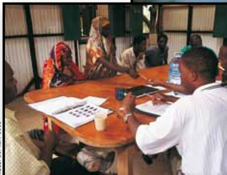
Στην Κένυα Σομαλοί Μπαντού περνούν από ατομική εξέταση ασύλου.