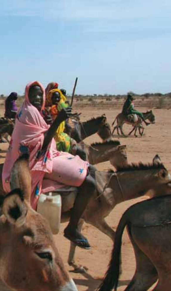
Εκτοπισμένες Σουδανές γυναίκες στο Νταρφούρ.