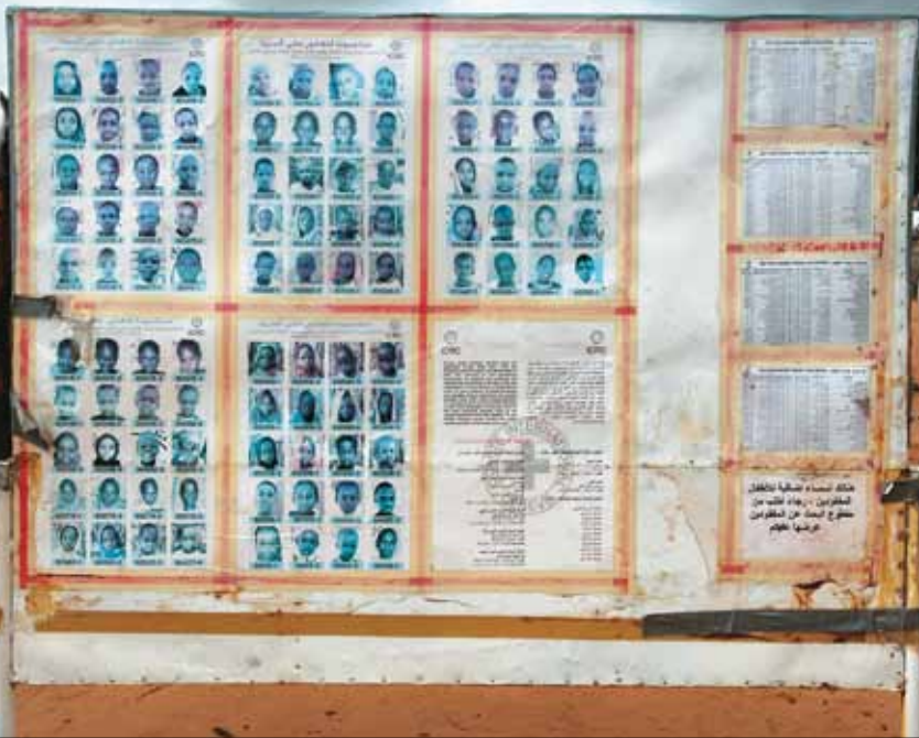
Προσπάθειες εντοπισμού συγγενών των παιδιών από το Σουδάν, που χωρίστηκαν από τις οικογένειές τους εξαιτίας του πολέμου στο Νταρφούρ.