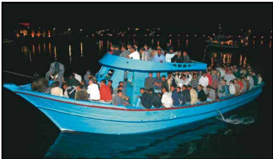
Βάρκα που αναχατίστηκε κοντά στο ιταλικό νησί της Λαμπεντούσα.

Σε τέτοιες περιπτώσεις, οι αξιωματικοί της Ύπατης Αρμοστείας προσπαθούν να διεξάγουν συνέντευξη στο πλοίο, και εφόσον αποδειχθεί ότι ο αιτών άσυλο θεωρείται πρόσφυγας, τότε παρέχουν βοήθεια στην εξεύρεση μόνιμης λύσης που είναι συνήθως η μετεγκατάσταση σε τρίτη χώρα.