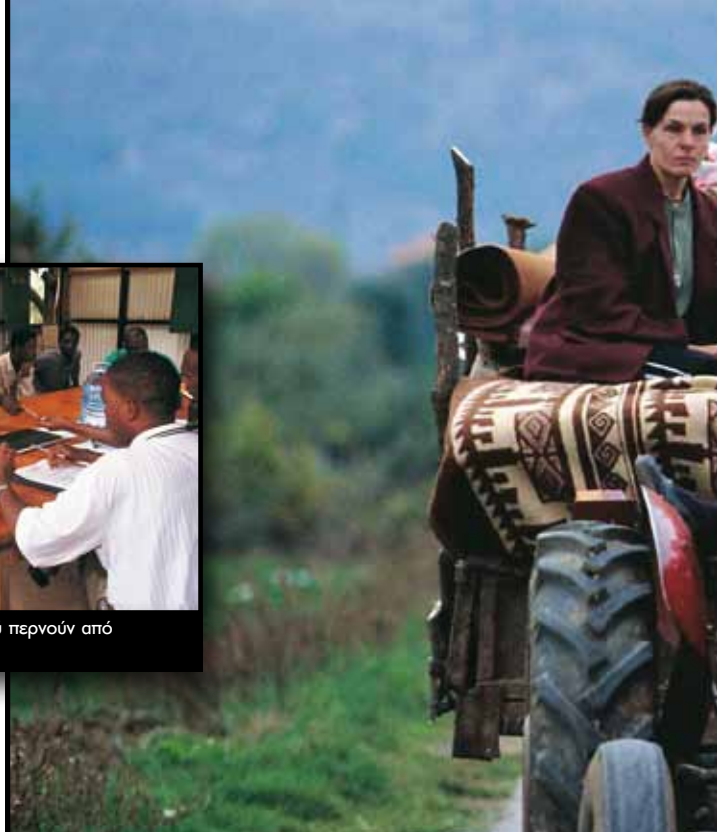
Κατά τη διάρκεια