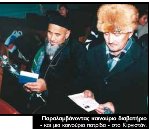
Παραλαμβάνοντας καινούριο διαβατήριο - και μια καινούρια πατρίδα - στο Κιργιστάν.

Η Ύπατη Αρμοστεία έχει υιοθετήσει μια Ατζέντα για τη Διεθνή Προστασία, δηλαδή μια σειρά από κατευθυντήριες οδηγίες που θα μπορούσαν να χρησιμοποιήσουν οι κυβερνήσεις και οι ανθρωπιστικές οργανώσεις για να ενδυναμώσουν την προστασία των προσφύγων παγκοσμίως. Επίσης, έχει αναλάβει διάφορες συγκεκριμένες πρωτοβουλίες που περιλαμβάνουν ένα διευρυμένο πρόγραμμα μετεγκατάστασης προσφύγων, επανένταξη των προσφύγων στις τοπικές κοινωνίες και καλύτερη κατανομή του βάρους αντιμετώπισης των αναγκών των προσφύγων ανάμεσα στις χώρες υποδοχής. Επίσης αναζητά προγράμματα που να γεφυρώνουν το κενό ανάμεσα στην επείγουσα βοήθεια προς τους πρόσφυγες και την μακροπρόθεσμη ανάπτυξη των πολιτών και των κατεστραμμένων κοινωνιών.