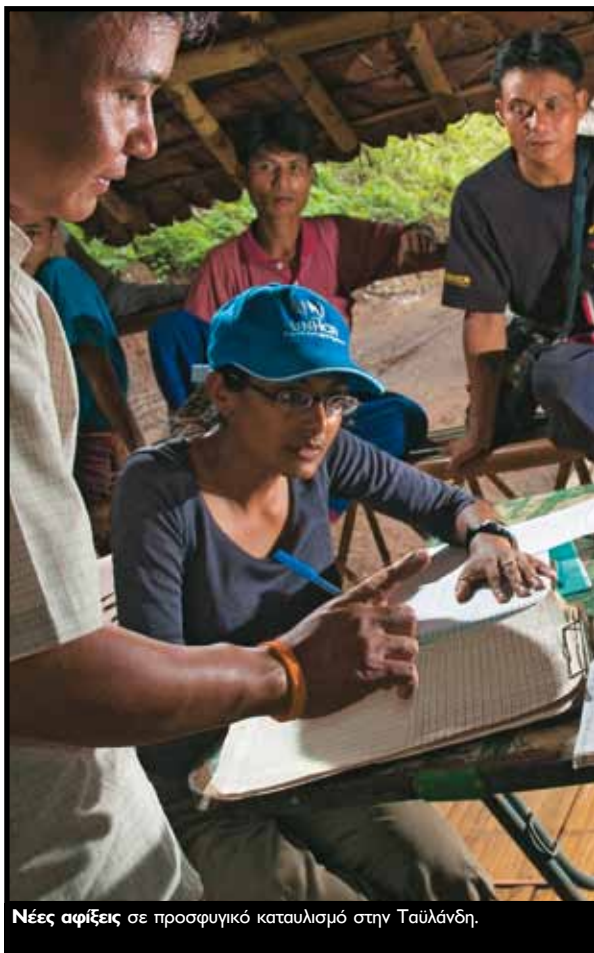
Νέες αφίξεις σε προσφυγικό καταυλισμό στην Ταϊλάνδη.

Ο ι πρόσφυγες πρέπει να σεβονται τους νόμους και τους κανονισμούς της χώρας ασύλου.