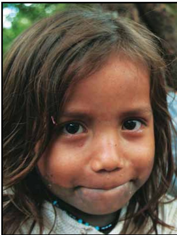
Κολομβιανή οικογένεια στον Παναμά.

Η προσωρινή προστασία δεν θα πρέπει να παρατείνεται επί αόριστο, και μετά από ένα εύλογο διάστημα θα πρέπει οι ενδιαφερόμενοι να μπορούν να ζητήσουν άσυλο. Αν αυτό απορριφθεί, θα πρέπει να μπορούν να παραμείνουν στη χώρα ασύλου μέχρις ότου είναι ασφαλές να επιστρέψουν στη χώρα τους.