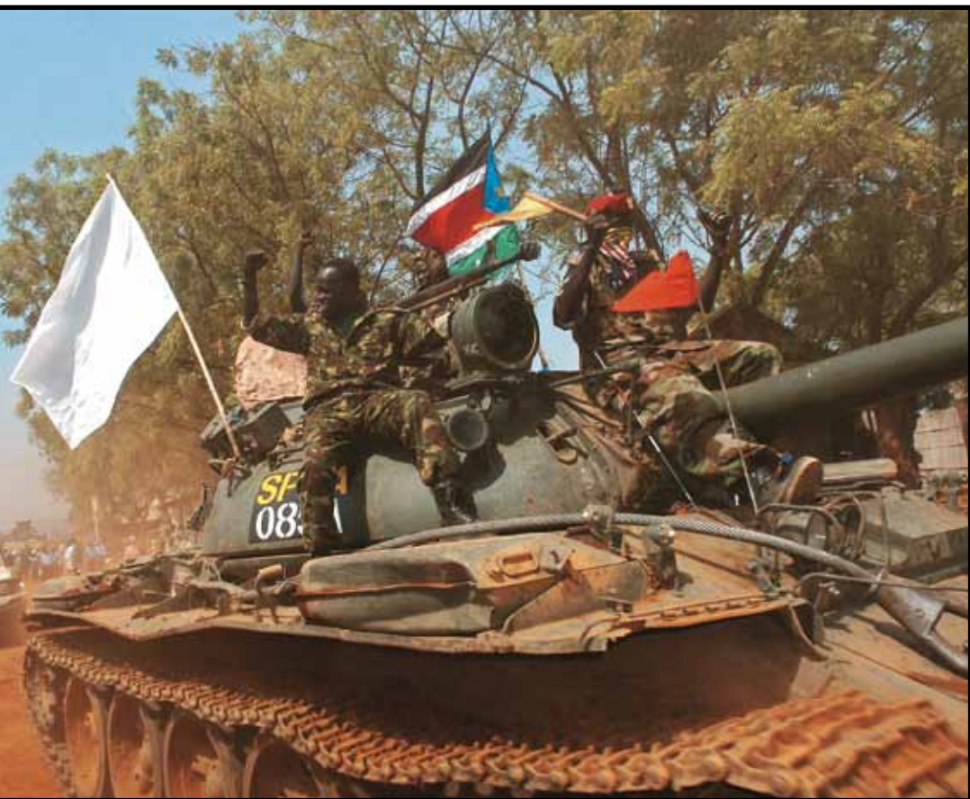
Στρατιώτες στην Τζούμπα, Νότιο Σουδάν.