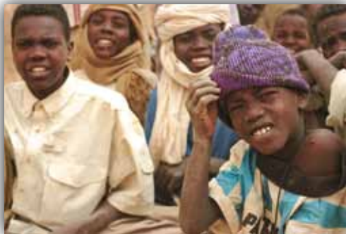
Ασυνόδευτα παιδιά περιμένουν και ελπίζουν σε προσφυγικό καταυλισμό στο Τσαντ.

του Ερυθρού Σταυρού και την οργάνωση «Σώστε τα παιδιά» για να διασφαλίσουν ότι τα ασυνόδευτα παιδιά αναγνωρίζονται και καταγράφονται, και πως οι οικογένειές τους έχουν βρεθεί. Στην κρίση της Ρουάντας στα μέσα της δεκαετίας του 1990, υπολογίζεται ότι 67.000 παιδιά ξαναβρήκαν τις οικογένειές τους.